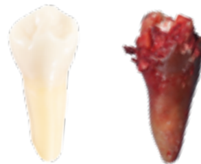
Vergleich eines gesunden Zahnes mit einem wurzelkanalbehandelten Zahn.

Das Problem dabei: Über die vielen kleinen Tubuli und Seitenkanäle wird der abgestorbene Zahn trotz Füllmaterial durch pathogene Bakterien besiedelt, welche das verbleibende organische Gewebe zersetzen und schädliche Stoffwechselprodukte (Toxine) absondern. Trotz entfernter Pulpa steht der Zahn jedoch weiterhin in Verbindung mit dem umliegenden Gewebe, sodass bei jedem Kauvorgang die Bakterien und deren Toxine in das Lymphsystem und die Blutbahn abgegeben werden (fokale Infektion). Der Zahnarzt wird durch sein Instrumentarium niemals in der Lage sein, alle Nebenkanäle des Zahnes abzudichten. Der wurzelkanalbehandelte Zahn stellt somit ein Störfeld für den gesamten Körper dar.